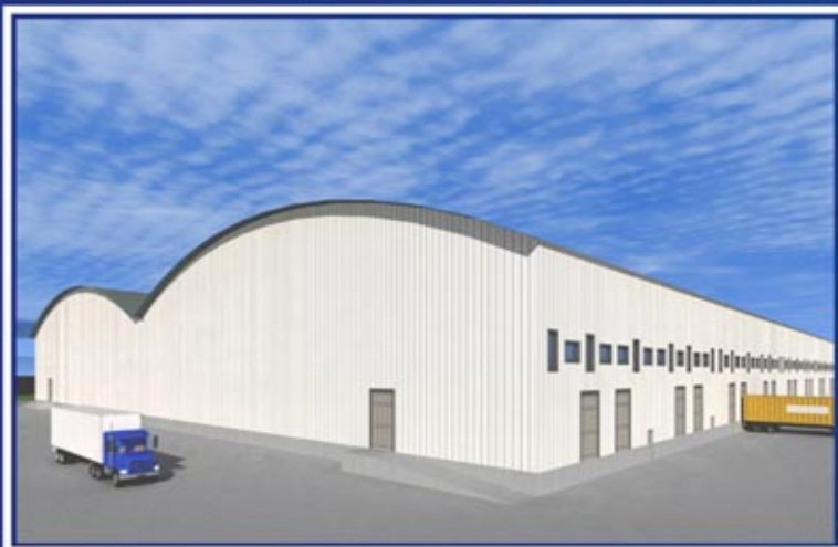
Бескаркасное здание типа Эксергия 121x220x12(н)м