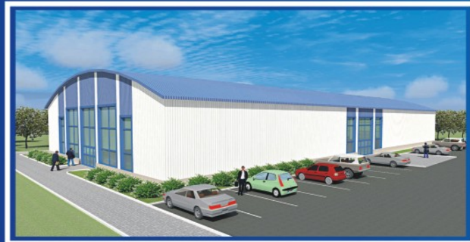
Бескаркасное здание однопролетное. Крытый рынок 30x60x6(н)м.