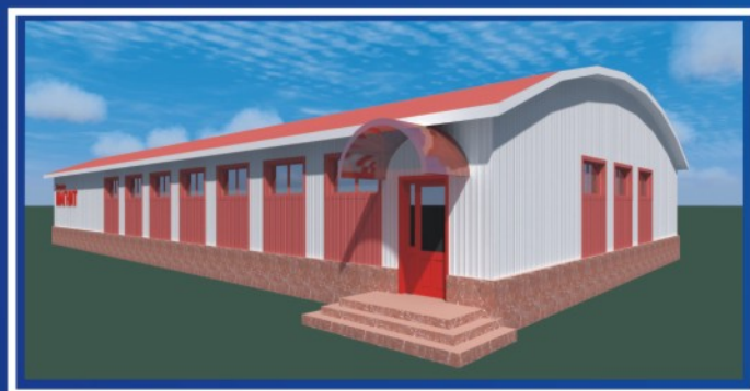
Бескаркасное здание однопролетное. Магазин 18x33x3,4(н)м.